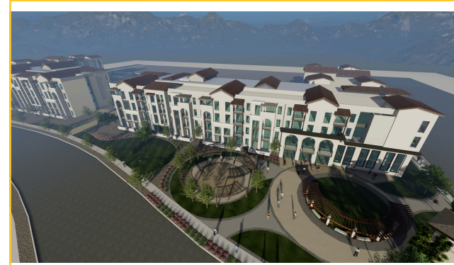
Representación del proyecto de desarrollo de viviendas asequibles propuesto en la parcela 3 del plan maestro de reurbanización del campo de Golf Desert Pines.

El objetivo de esta Asociación Público-Privada es complementar la Comunidad del Este de Las Vegas con calles amigables para peatones, diseños de edificios de alta calidad y espacios de reunión para la comunidad.